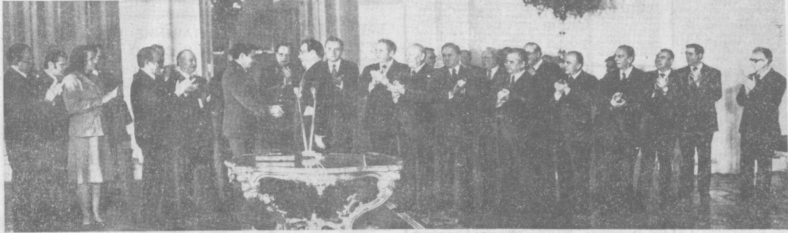
Во время вручения награды.

Дорогой товарищ Брежнев! Прошло лишь несколько месяцев, как Вы написали мне, поздравив меня с пятидесятилетием. Сегодня я имею удовольствие ответить Вам взаимностью на Ваше теплое поздравление. Наша партия и весь наш народ разделяют с советскими коммунистами и всем советским народом огромную радость видеть Вас, прошедшим и 70-летие, предисполненным здоровьем и бодрости. Глубокое значение этой годовщины заключается в том, что Вы, проделав долгий путь, начиная от самых скромных должностей и до самых высоких политических постов современного мира, посвятили свою жизнь благородному и справедливому делу народов СССР и всего человечества. Вам довелось жить в исключительную эпоху, когда начался переход от капитализма к социализму и Вы имели тройную привилегию быть сыном народа, осуществившего этот переход, быть учеником гениального руководителя, приведшего советский народ к великой победе, и особенно то, что Ваши способности и заслуги привели Вас на высший руководящий пост героической партии, которая совершила столь величайший подвиг. Примите в этот день от любящего и восхищающегося Вами народа самые искренние поздравления, выражения глубоких чувств и благодарности за все то, что Вы сделали для Кубы, а также наилучшие пожелания здоровья и успехов от Вашего друга и соратника по борьбе. Первый секретарь ЦК Компартии Кубы Фидель КАСТРО РУС