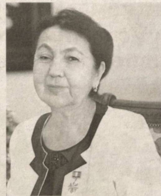
кўрсатилаётганлиги, ушбу касбнинг жамиятдаги обрўси ва нуфузини оширишга, уларнинг меҳнати ҳам моддий, ҳам маънавий жиҳатдан қўллаб-қувватланаётгани бизни янада яхшироқ ишлашга руҳлантирмоқда.

Кўёш ўзининг заррин нурлари билан табиатга жон ато этгани сингари устозлик маҳорати, салоҳияти ва тажрибаси билан ўз шогирдлари қалбини илм зиёси ила тўлдирган олган Муҳаббат Шарапова бугун нафақат давлатимизнинг энг юксак унвони соҳиб, балки чин маънода замонамиз қаҳрамонидир. Зеро, унинг босиб ўтган умр йўли, меҳнатсеварлиги, ватанпарварлиги, муаллим сифатида яратган ўзига хос ҳаёт мактаби ёш авлод учун ибрат ва намуна мактабидир.