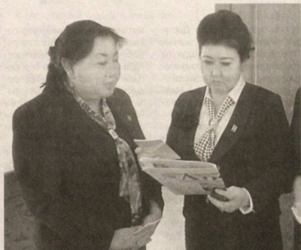
Шунингдек, ҳисобот даврида депутатлик гуруҳи ташаббуси билан халқ депутатлари шаҳар Кенгаши сессиясида 2 та, тегишли доимий комиссиялар йиғилишларида 3 та масала кўриб чиқилишига эришилди.

Партиянинг сиёсий майдонда муносиб ўрин эгаллашида ва кенг омма ўртасида нуфузининг кўтарилишида ушбу партиядан сайланган депутатларнинг фаоллиги, профессионал маҳорат билан ишлаши муҳим ўрин тутди.