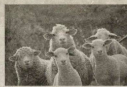
дан шикоят қилишган.

Синфларнинг қисқартирилиши зарурати ўқувчиларнинг сони камайиб кетгани билан тушунтирилган. Ота-оналар бунинг оқибатида синфларда ўқувчилар сонининг ошиши ва мос равишда, таълим сифатининг ёмонлашиши мумкинлиги-