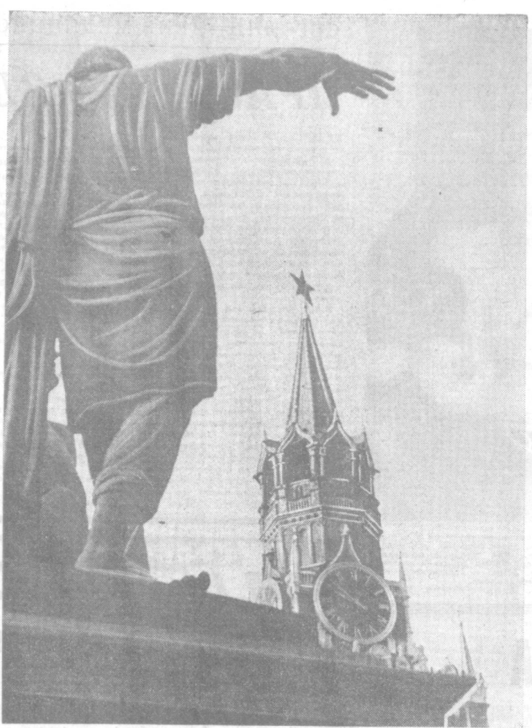
На фотоконкурс «Правды Востока» «Золотой юбилей». МОСКОВСКОЕ ВРЕМЯ.