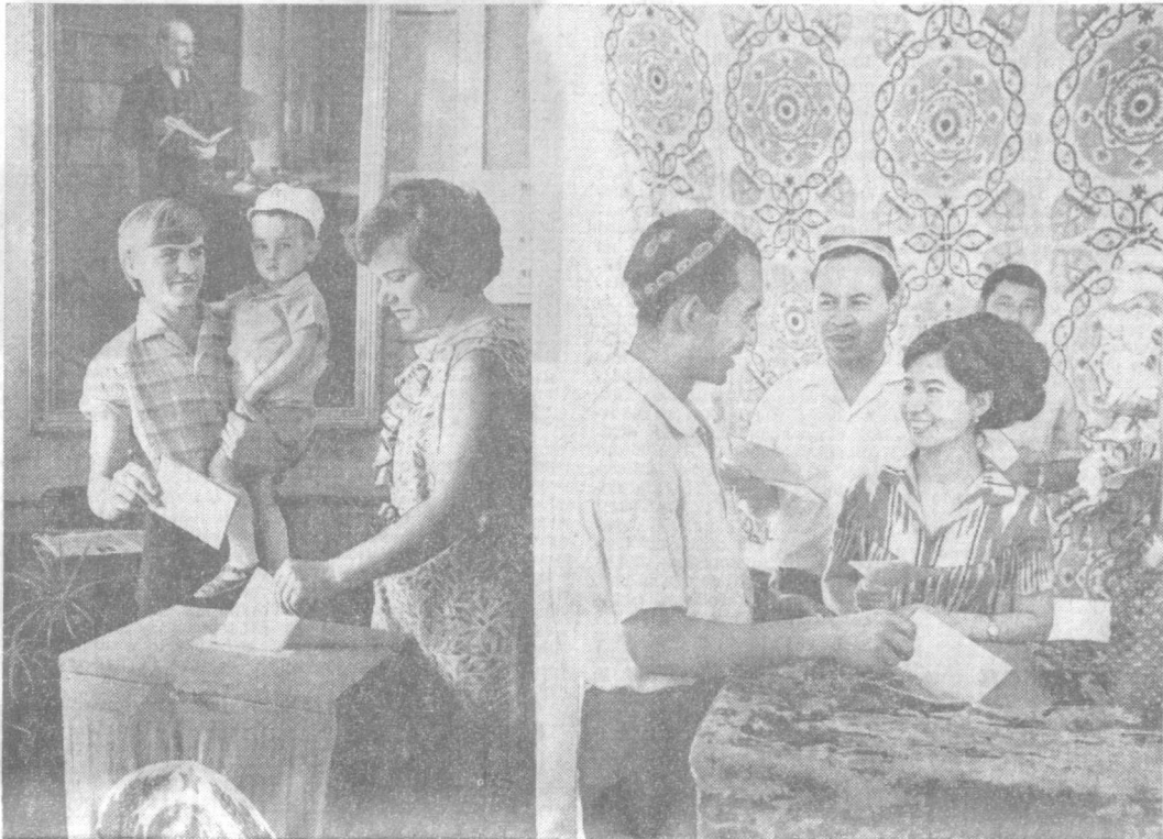
Голосуют ташкентцы. На снимках: слева — в зале голосования избирательного участка № 8/65 Ленинского района столицы; справа — свои бюллетени опускают в урны жители Сайбир-Рахимовского района, пришедшие на избирательный участок № 90/25.