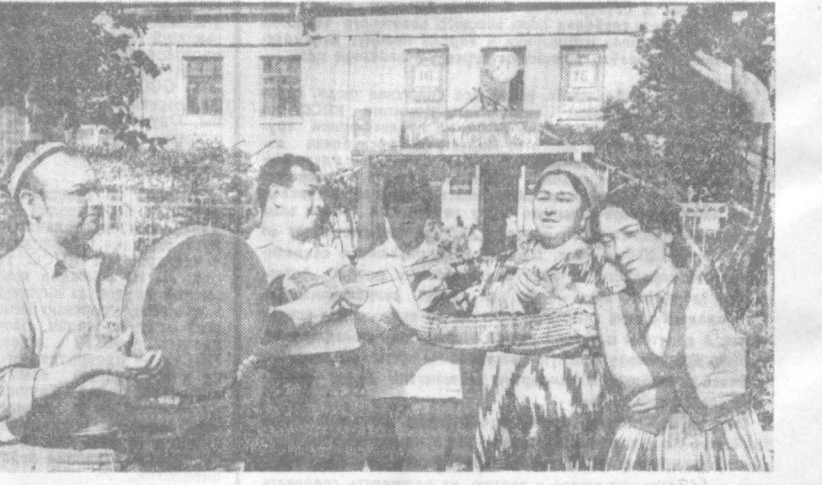
С раннего утра на избирательных участках столицы Узбекистана звучали музыка, песни, выступали артисты, ансамбли. Перед избирателями Сайир-Рахимовского района выступил ансамбль районного Дома культуры.

Счастья, крепкого здоровья и долголетия вам, уважаемая Аманбике-шешек, всей вашей большой и славной семье!