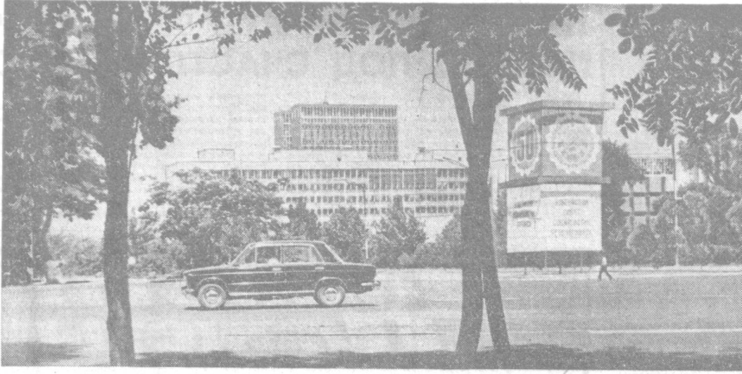
Тот из гостей нашего города, кто периодически его посещает, не может не раздаться стремительному росту строительства в столице Узбекистана. Десятки юбилейных объектов строятся в виде и находятся в стадии завершения. Большие работы ведутся на площади имени В. И. Ленина. К юбилейным торжествам она предстанет в совершенно новом виде. На этом снимке — один из уголков Ташкента.