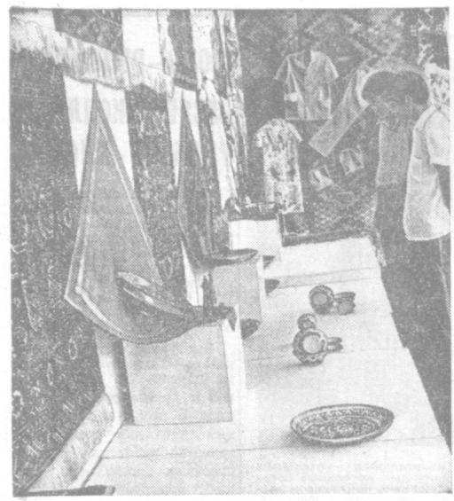
Изделия народных умельцев Хорезма на ВДХХ Узбекской ССР.