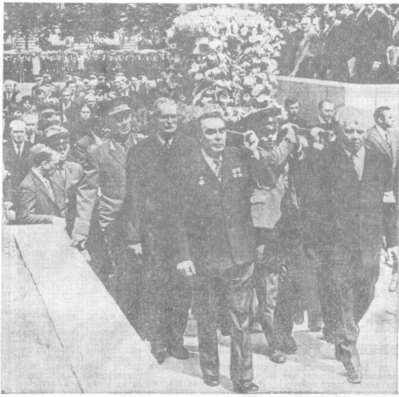
Руководители Коммунистической партии и Советского правительства несут урну с прахом Маршала Советского Союза Г. К. Жукова.