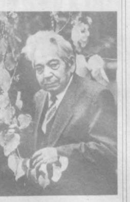
узбек халқининг суюкли санъаткорларидандирлар.