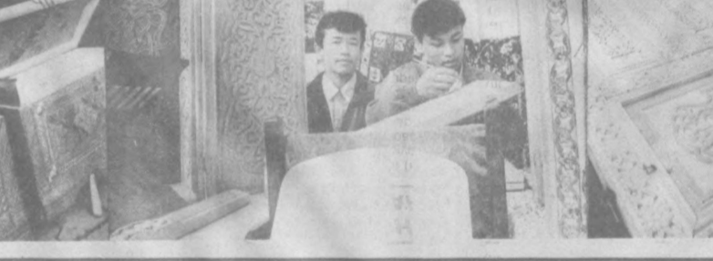
Тоҳир НОРҚУЛ олган суратлар