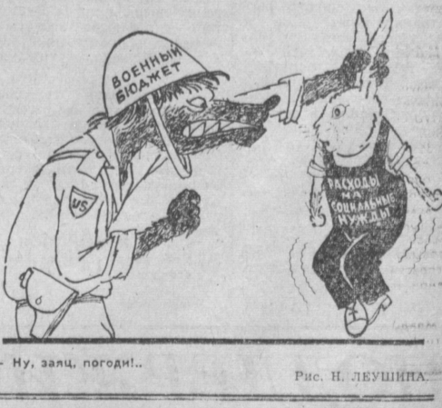
— Ну, зац, погоди! Рис. Н. ЛЕУШИНА.

На года в год растет военный бюджет США и сокращаются расходы на социальные нужды.