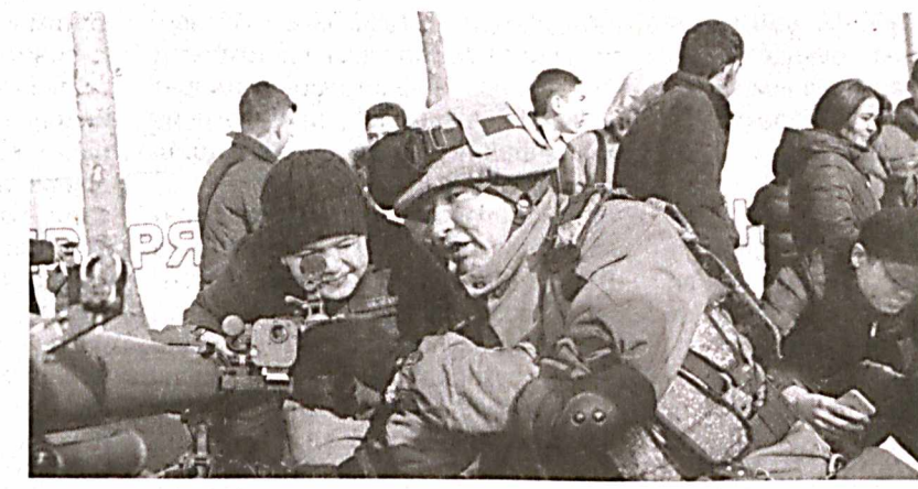
Навоий вилоятида уюштирилган "Армия ва ёшлар" фестивалида ҳудуддаги ҳарбий қисмлар аскар ва офицерлари ўз жанговар тайёргарлиги, маҳорат ҳамда эҷчилигини намойиш қилди.

кам 10 минг нафари қатнашган бўлса, "Армия ва ёшлар" фестивали 15 минг йилгит-қизни жамлади. Бинобарин, 876 та маҳалла фуқаролар йиғинида ҳарбий хизматчилар, соҳа фахрийларини қутлаш тadbирлари ташкил этилди. "Нуроний" жамғармаси ҳамда "Ватанпарвар" ташкилоти ҳамкорлигида хизмат вазифасини ўтаётган пайтда ҳалок бўлган 16 нафар ҳарбий хизматчи оиласига моддий ва маънавий ёрдам кўрсатилди.