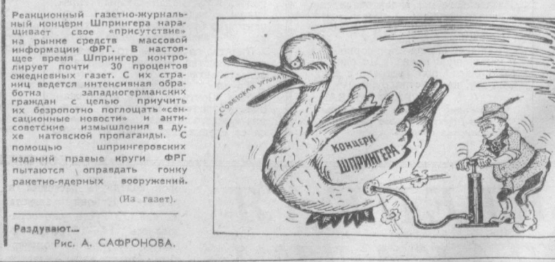
Раздувают... Рис. А. САФРОНОВА.

Редакция газетно-журнального издательства Шпрингера наращивает свое присутствие на рынке средств массовой информации ФРГ. В настоящее время Шпрингер контролирует почти 30 процентов ежедневных газет. С их стороны ведется интенсивная обработка западногерманских граждан с целью принудить их безропотно подложить «сенсационные новости» и антикоммунистическую пропаганду. С помощью шпрингерских изданий правые круги ФРГ пытаются оправдать гонимые ракетно-ядерные вооружения. (На газет).