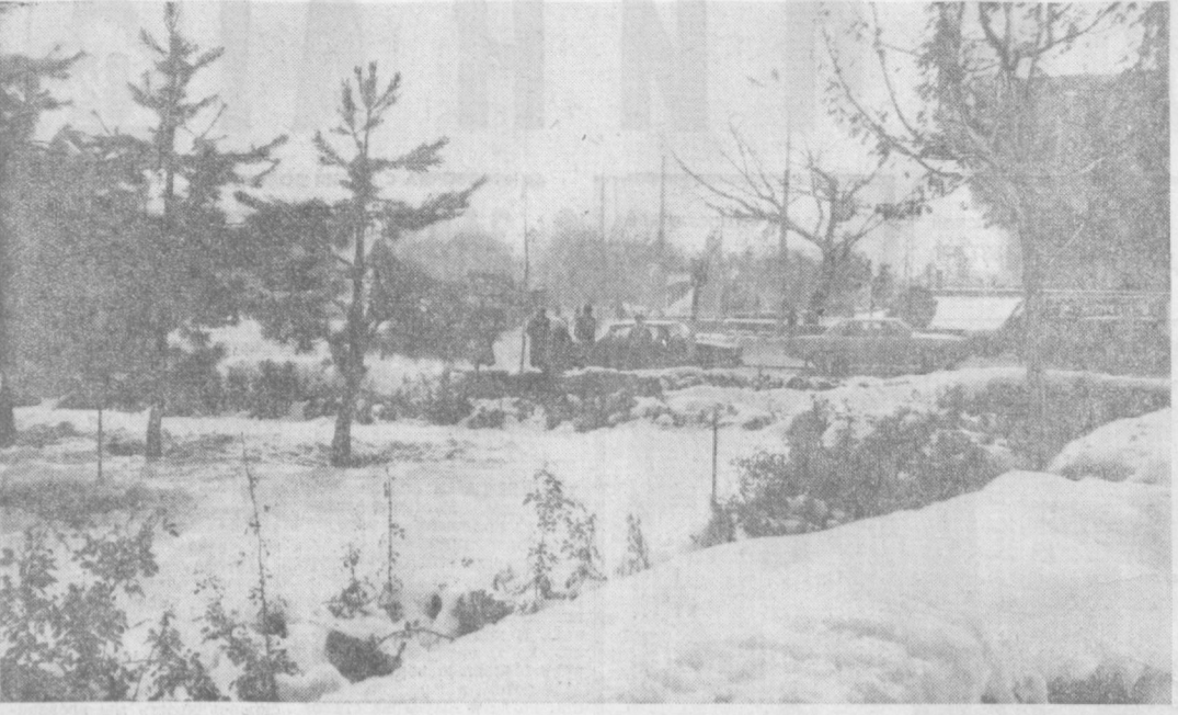
Пришла зима.