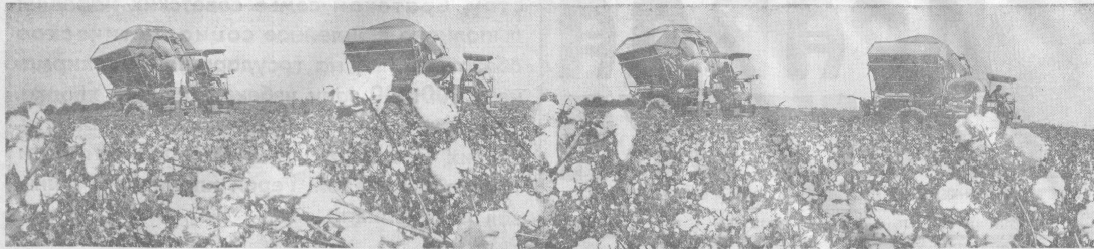
Горячие дни страды.