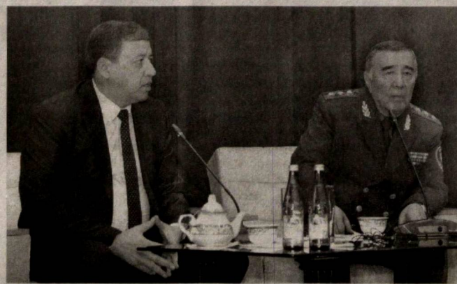
В Ташкентском государственном аграрном университете прошло культурно-просветительское мероприятие, посвященное воспитанию молодежи в духе патриотизма и преданности Родине и предотвращению правонарушений среди студентов.