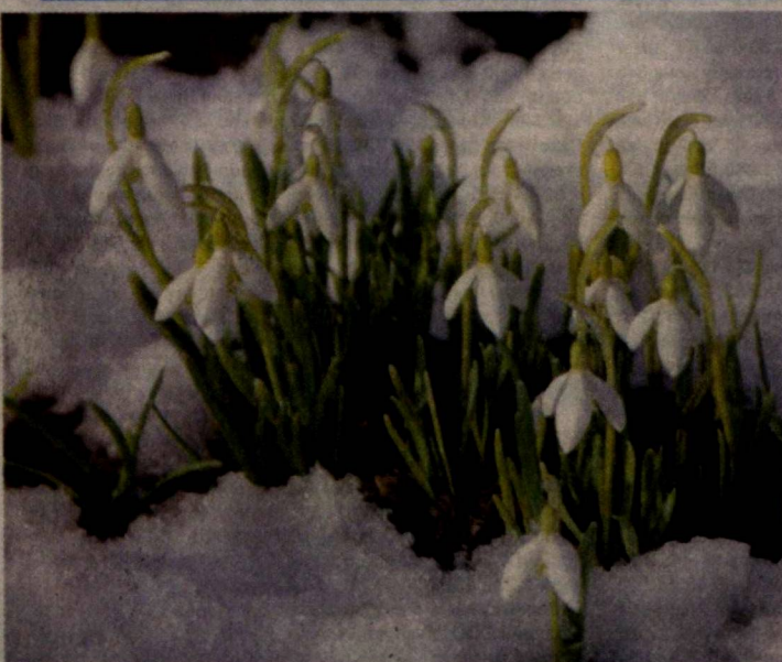
Первые весенние цветы в горах