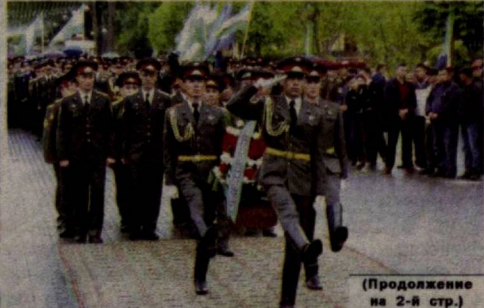
(Продолжение на 2-й стр.)