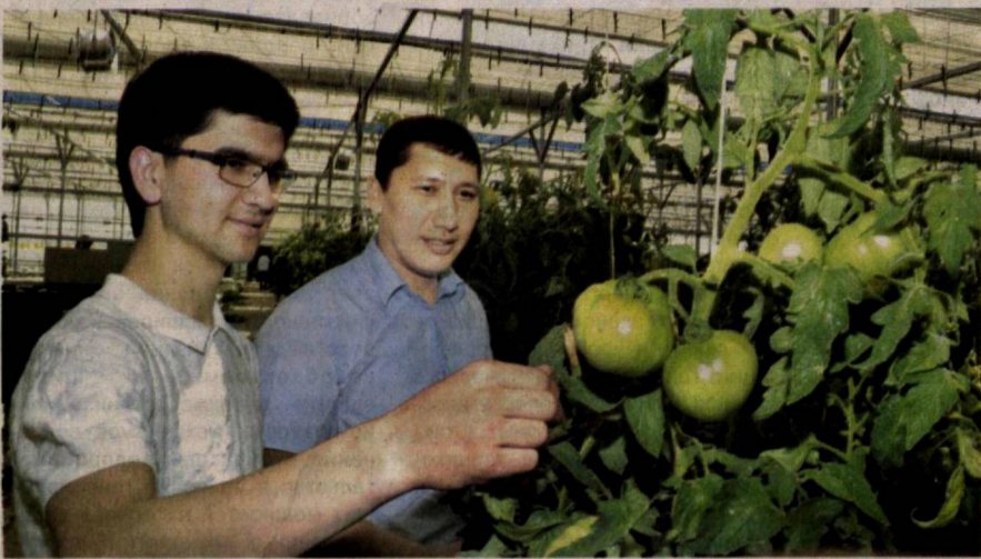
По инициативе Министерства энергетики Республики Узбекистан большая группа журналистов в ходе медиатурна ознакомилась с большой планомерной работой по поэтапному переводу теплиц, использующих для отопления газ, на уголь.