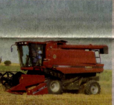
Здесь урожайность составила от 80 до 97 центнеров на круг. Вали КАДЫРОВ

Зерноводы области несмотря на капризы погоды смогли собрать богатый урожай пшеницы, сдав на приемные пункты более 362 тысяч тонн отборного зерна.