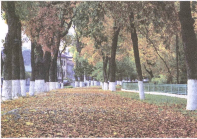
Одамро марги хамасрон кунад донои вақт, Сарв хангоми хазон дар боғ якто мешавад.