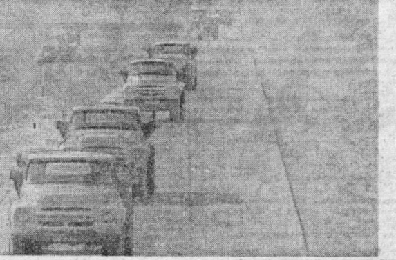
Вот он, живой конвейер машин!