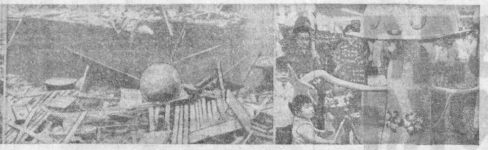
Положение в западногерманской экономике ухудшается. Некоторые ее отрасли переживают серьезный кризис. Как свидетельствует сам министр хозяйства ФРГ Шиллер в газете «Индустризур», «Большая трудность», например, у автомобильной промышленности. Подобно тому, как в Рурской области вынуждены закрыть заводы по производству чугуна, в Рурской области вынуждены закрыть заводы по производству стали. Американские агресоры не прекращают варварских налетов на Демократическую Республику Вьетнам. Их бомбы падают на мирные города и села, убивают женщин и детей. На снимке: в помещении средней школы на окраине Ханоя после налета американских бомбардировщиков. Этот робот поет, танцует, разговаривает — словом, делает все, что способствует рекламированию и продаже товаров. Такого помощника приобрел себе за большие деньги тонкий университет.

Так выглядит на деле «свобода» радиостанций Колумбии. Журналы, издающиеся в Колумбии, принадлежат империалистам.