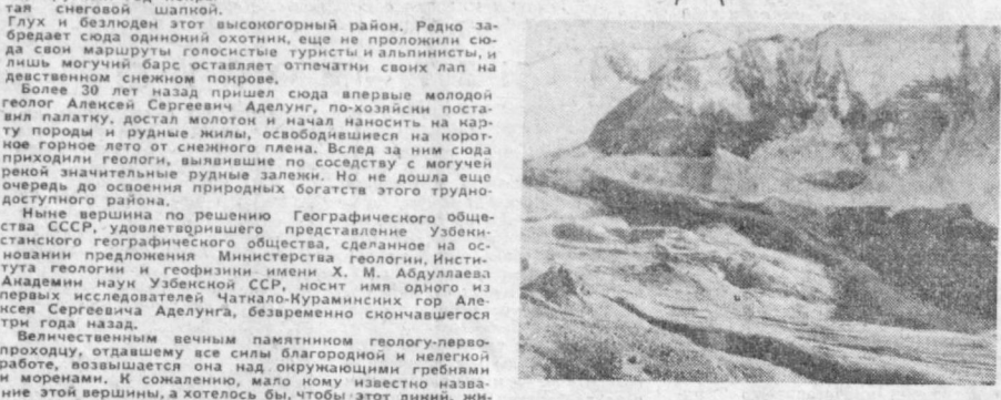
На заднем плане — вершина Аделунга.