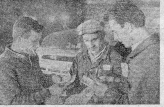
Братья Смирновы из Рошальска.