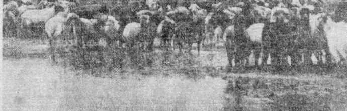
Сто тысяч овец в отарах крупнейшего в автономной республике животноводческого совхоза имени Карла Маркса Тахтаатинского района.