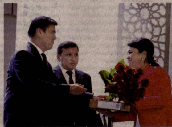
зультатов в своей благородной и нужной профессии.