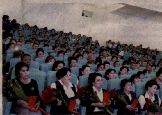
Вчера в городе Алматы во Дворце культуры "Металлург" в торжественной обстановке с Днем учителей и наставников поздравили преподавателей вузов, школ, лицеев и колледжей, воспитателей дошкольных образовательных учреждений из городов и районов нашей области, добившихся наилучших ре-

Шавкат МИРЗИЕВ, Президент Республики Узбекистан