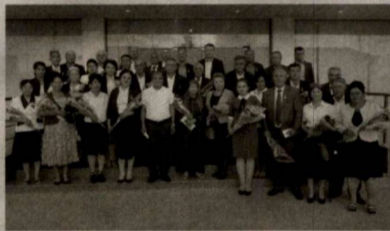
внимание, пообещали и впредь вносить вклад в повышение роли и значения института махаллы в жизни государства и общества.

Награжденные выразили благодарность Президенту страны за проявленную заботу и