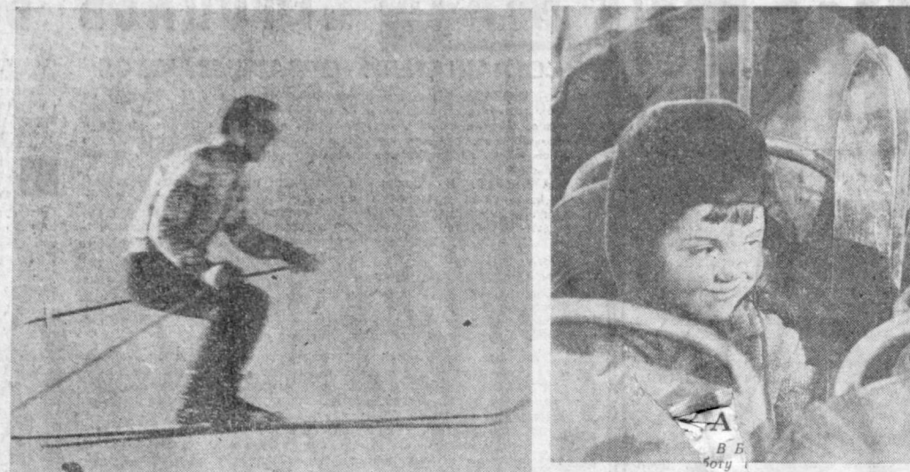
На фото конкурс «Октябрь и мы»

Начальник Азербайджанского отряда Института истории и археологии Академии наук Узбекской ССР, кандидат исторических наук.