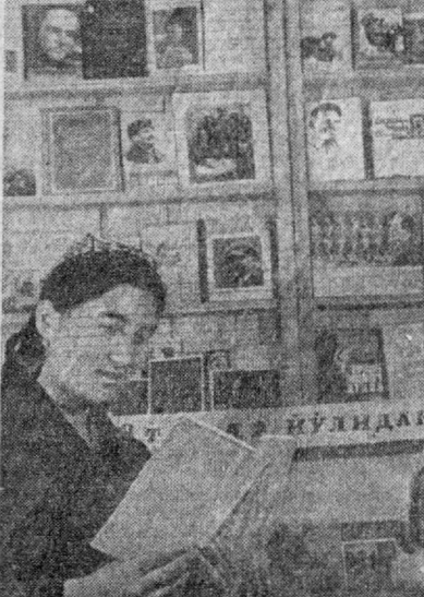
Сельская библиотека Булунгурского района насчитывает свыше семи тысяч книг.