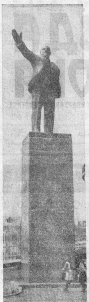
УРГАН. Памятник основателю Коммунистической партии и Советского государства Владимиру Ильичу Ленину.