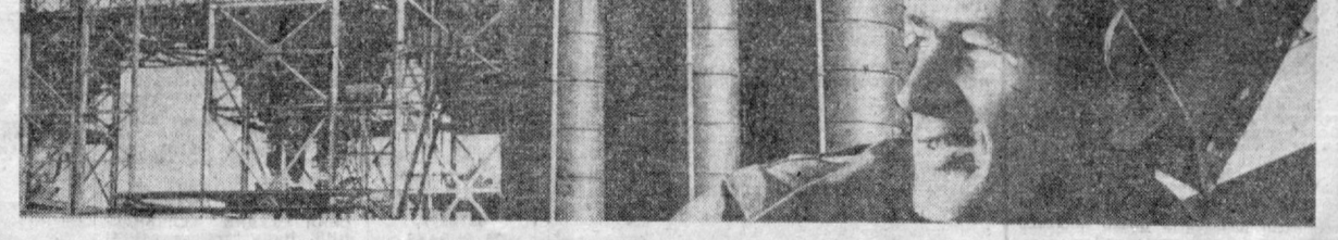
Продолжение. Начало в «Правде Востока» за 20 января.