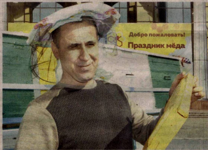
Добро пожаловать! Праздник меда

Пчеловоды привезли на выставку, организованную Ассоциацией пчеловодов Узбекистана совместно с АК "Алокабанк", более ста сортов меда и продукции пчеловодства. Все желающие могут попробовать горный и хлопковый, цветочный мед и приобрести понравившиеся образцы.