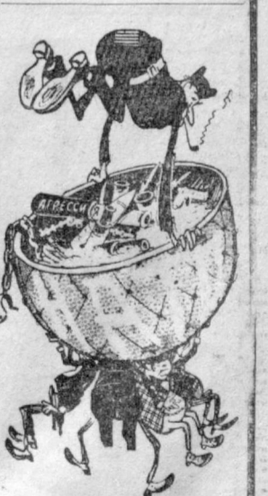
Внимает на нунды НАТО. Рис. В. Жуков.

ХАНОЙ, 9 февраля. (ТАСС). Юношеские патриоты атаковали 7 февраля два американских аэродрома — Чану (провинция Чаньин) и Чанон (провинция Шоньань). Минутными огнями уничтожено несколько американских самолетов. В тот же день патриоты взорвали склад с горючим на американской авиабазе в Бьенхо.