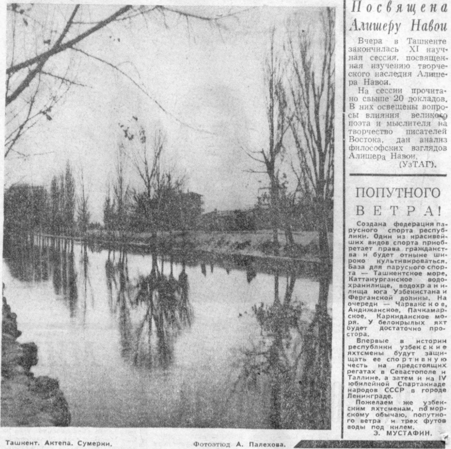
Ташкент. Актёпа. Сумерки.

Андижанская область, Задарьинский район.