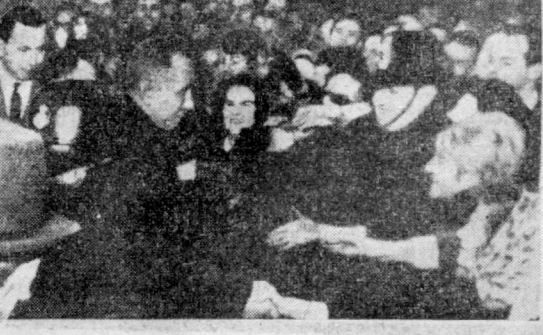
Приветствие Председателя Совета Министров СССР А. Н. Косыгина в Великобритании. На снимке — рабочие фирмы «Элиот стейтсмен» в городе Борнемууд приветствуют главу Советского правительства.

Вчера же Премьер-министр Гарольд Вильсон дал официальные завтрак в честь Председателя Совета Министров СССР А. Н. Косыгина.