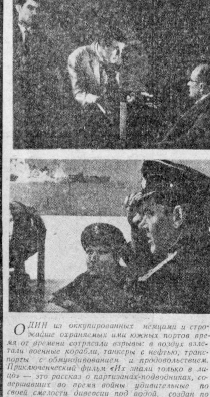
Один из оккупированных немцами и строга охраняемых ими южных портов...