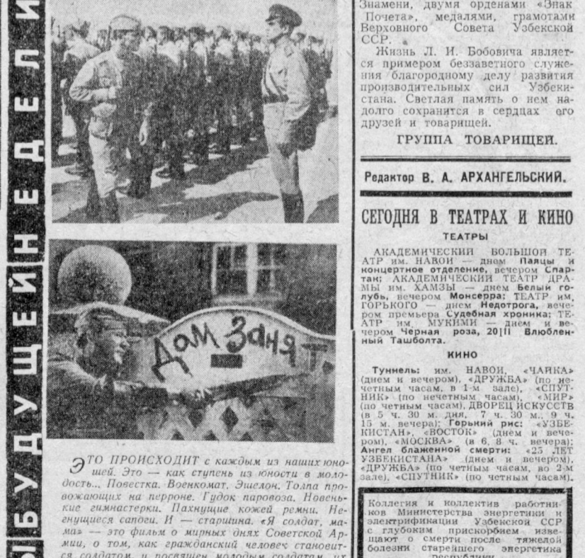
ЭТО ПРОИСХОДИТ с каждым из наших юношей. Это — как ступень из юности в молодость...