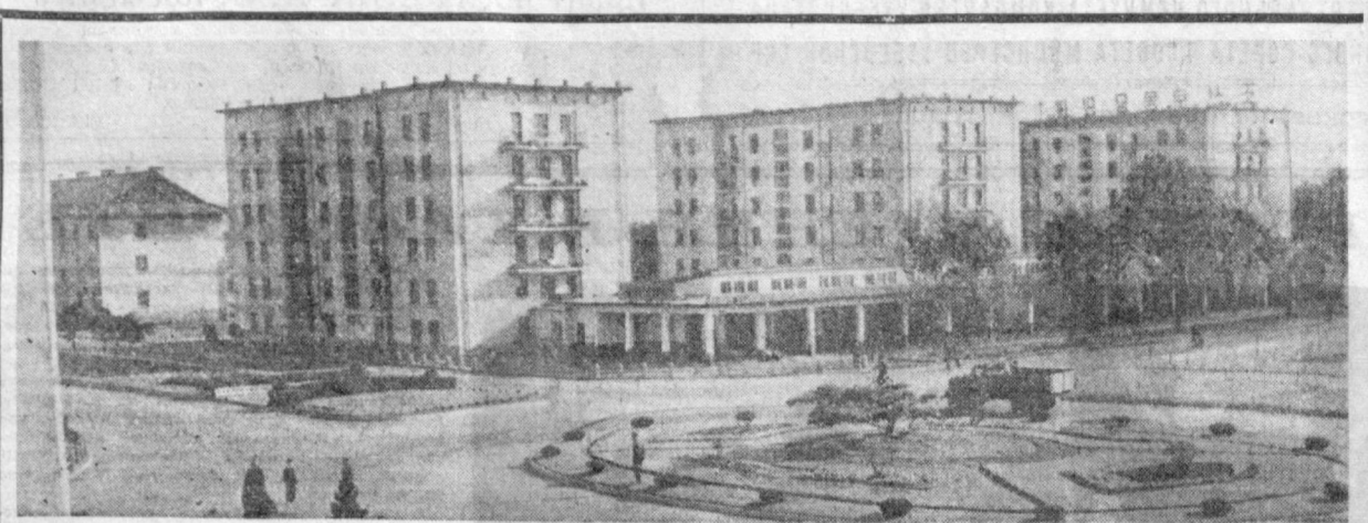
Корейская Народно-Демократическая Республика. Одна из площадей в городе Хамхунге.