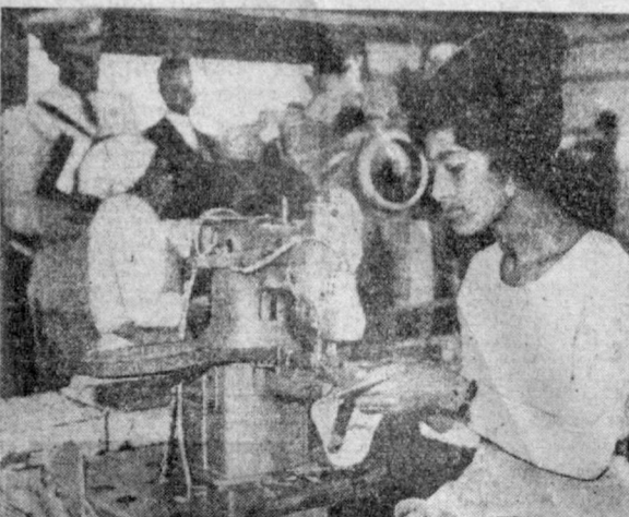
Социалистические страны оказывают большую помощь Эфиопии в развитии национальной экономики. В содружестве Чехословакии в стране построено несколько промышленных объектов, в том числе швейная фабрика в Адиис-Абебе. На снимке: в одном из ее цехов.

ПО ДАННЫМ министерства труда и национальной службы Австралии, число безработных в стране на 1 февраля составило 89 тысяч человек. Это на 12,5 тысячи человек больше, чем их было в декабре прошлого года.