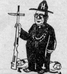
«До полной победы». Рисунок из алжирской газеты «Эль-Муджахид».