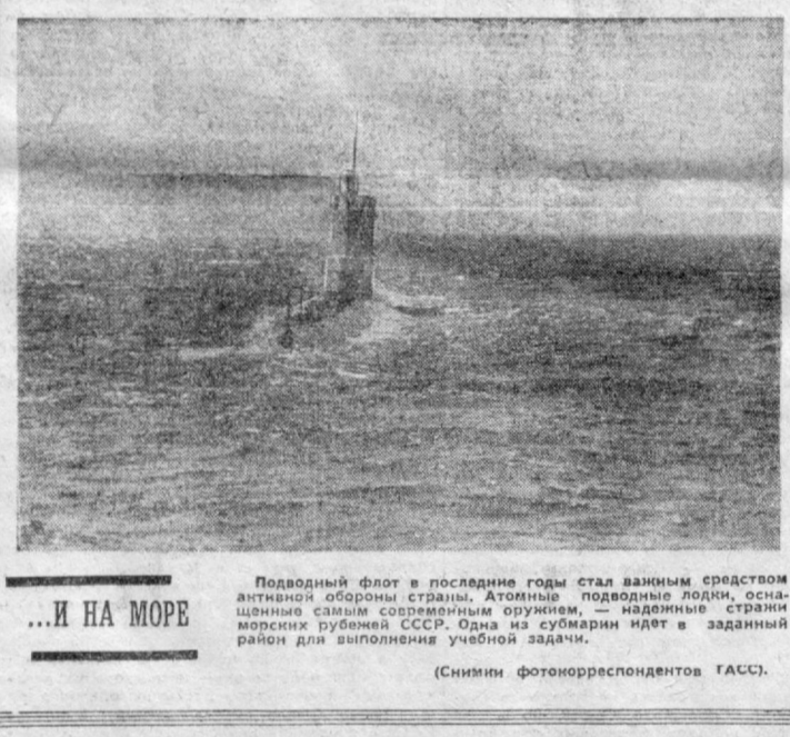
...И НА МОРЕ

Будни советских воинов — это напряженный каждодневный труд по овладению боевой техникой. На этом снимке запечатлен момент учений военновоздушной. Истребитель-ракетосец поражает цель ракетой.