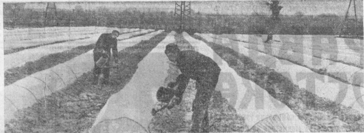
Большие площади отведены под ранние овощи в колхозе имени Карла Маркса Калининского района. Они зреют под полиэтиленовым покрытием. На снимке: один из участков плантации.

Чем же было вызвано такое «огораживание» посевных земель? Делало это неспроста. Не только любовь к деревьям диктала