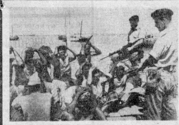
Адеи. Под дулами автоматов англоамериканских солдат на палубе сидит экипаж арского судна. А на боробе в это время идет обстрел. Идут оружье и боеприпасы, которые моряки могли доставить в Аденискую гавань.