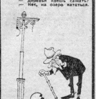
— Откуда здесь могли появиться страусы?