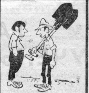
— Деревья идешь санать? — Нет, на озере катаюсь.