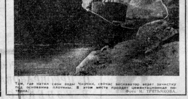
Там, где натил свои воды Чирчик, сейчас экскаватор ведет зачатку под основание плотины. В этом месте пройдет цементная плотина.

Все области Узбекистана и Каракалпакская АССР перевыполнили план заготовки мяса, Ташкентская и Бухарская области — молока, Анжуйская и Кашикарская области — яиц.