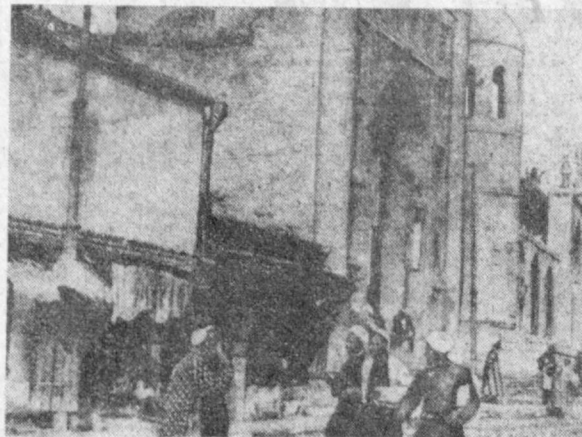
С той же точки

Решением исполкома Ташкентского городского Совета депутатов трудящихся улица Горькая переименована в улицу имени Талибидана Садикова.