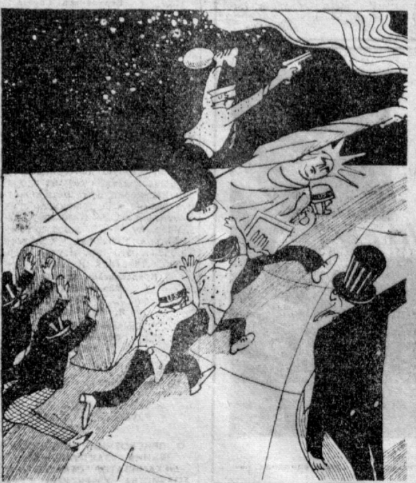
Несут «Свободу». Рисунок художника «Крокодила» Е. Горохова для «Правды Востока».

Новая линия электропередач Бойчиновци (Болгария) — Крайова (Румыния) напряжением 220 киловольт вступит в эксплуатацию в этом году. Таким образом будет завершено объединение на параллельную работу всех энергосистем социалистических стран — участниц Центрального диспетчерского управления: Болгария, Венгрия, ГДР, Польша, Румыния, Советский Союз и Чехословакия. На болгарской земле строительство высоковольтной линии электропередач подходит к концу. На снимке: подстанции в Бойчиновцах. Отсюда электрический ток будет поступать в города и села народной Болгарии.