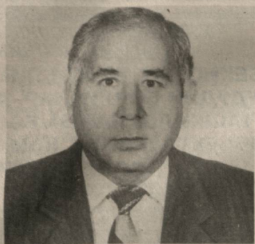
Нодир БЕРДИҚУЛОВ, Оққўрғон тумани ҳокими, Ўзбекистон Олий Мажлиси депутати

Етмиш йиллик собиқ иттифок даврида оққўрғонликлар ҳам тер тукиб меҳнат қилсалар-да, бирлари икки бўлмади. Қишлоқ қашшоқлигига қолди. Сабаби машаққат эвазига етиштирилган пахта ҳосилили сув-текинга сотдик. Истиқлол, ҳукуматимиз, хусусан Президентимиз Исом Каримовнинг том маънодаги халқпарвар сиёсати туфайли қишлоқни, қишлоқ ҳужалигини ривожлантиришга амалда катта эътибор берилмоқда. Ана шу мақсад учун маблагни ашмавати. Республика Вазирлар Маҳкамасининг «2000 йилгача бўлган даврда Ўзбекистон Республикаси қишлоқ ижтимоий инфраструктурасини ривожлантириш дастури тўғрисида»ги қарори ҳам ғаллаги ғамхўрликнинг ёрқин куралишидир. Бунедкорлик дастурида амалга оширилган кенг куламлиги ишлар аниқ режалаштирилган, уни маблаг билан таъминлаш, ана шу маблагларни буюртмачилар ҳамда асосий пудратчи ташкилотлар буйича тақсимлаш ишлари қўлга киритилган.