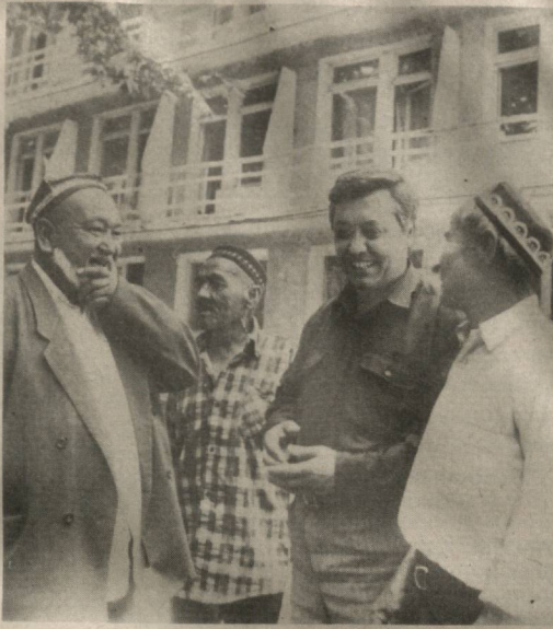
«Оққўрғон» санаторийси республикадаги энг намунали шифо масканларидан бири саналади.

Бугунги кундаги энг муҳим масалалардан бири ҳисоб-китоб масаласидир. Қишлоқ ҳужалиқ маҳсулотини учун ҳисоб-китоб қилаётган қорхоналарга оборот айланма маблагларни ажратиш буйича бир қатор чора-тадбирлар қўрилганини аниқ мўлдоа бўлди. Бундан ташқари ҳукуматимиз бўлгуси ҳосилдан харид қилиш учун ҳужалиқларга аванс тулаш тўғрисида қарор қабул қилинганлиги ҳам деҳқонлар кўнглини тоғдек қутарди. Туманимизда Вазирлар Маҳкамасининг юқорида қайд этилган қарори асосида кенг бунедкорлик ишлари амалга оширилади. Илм масканлари, соғлиқни сақлаш муассасаларини қуриш, мавқуларини таъмирлаб, ишни намунали йулга қуйишга эришилди. Амалга оширилган тадбирлар туфайли жамоаларда ижро имтиҳонини мустаҳкамлашга, соғлом, узаро талабчанлик муҳитини яратишга эришилди. Барча пировард натижа учун узини масъул деб билаётган. Ҳамма сый-ҳаракат ноз-неъмат бунедкорларининг яхши ишлари, истиқболга қаратилмоқда. Зеро, юртбошимиз таъкидлаганларидек, давлатимизда деҳқон даромади, ҳаёти, насибаси бугун экан, юртимиз обод, иқтисодимиз мустаҳкам бўлаверди!