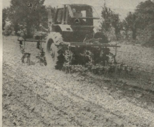
Навоий номли жамоа ҳўжалигида ғуза ниҳолларига ишлов берилаётган пайт.

Беҳад шукр, тоғанимиз энди узимизники. Қазилма