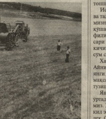
Боёвут галлазорларида ҳам урим-йигимга қизгин киришилди.