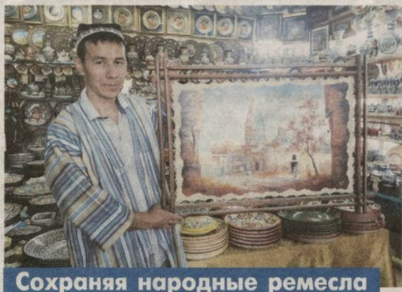
Сохраняя народные ремесла