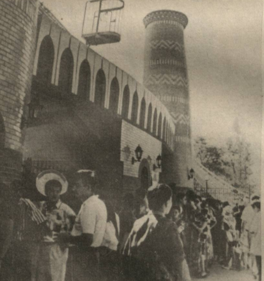
Пойтахтимизда Туркиянинг «Айсел» фирмаси билан ҳамкорликда Диснейленд ва Аквопарк барпо этилган. Бу бoр нафақат шаҳарлик ешларга, балки республикамизнинг тури вилоятларидан ташриф буюрган кичиктойларга намунали хизмат кўрсатапти.

СУРАТДА: боғнинг олд томонидан умумий кўриниши.