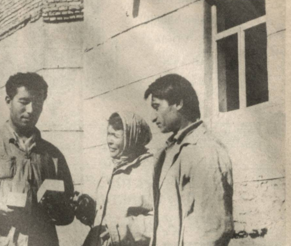
ҚУРИЛИШ БАҲҚАРОРЛИК БЕЛГИСИ