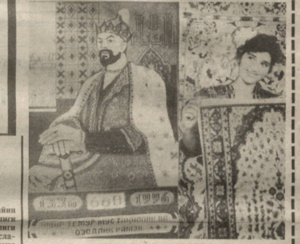
Мананган тумани «Тошбулоқ» қишлоғидаги «Турк-Ат-лас» Ўзбекистон-Туркия қўшма корхонаси 20 дан ортиқ харидорбон маҳсулотлар ишлаб чиқармоқда. Корхона мустақиллик меваси. Бунёд этилганга тўрт йил бўлди. Ярим йилдирки, ишлакдан гилам тўқини йўлга қўйилди.

Хизмат бурчи билан бир-рор хоризжий мамлакатга бор-гулай бўлсангиз, у қай дара-жада гузал, афеонавий мам-лакат бўлмасин учинчи ку-шиек бутун вужудингиз уйга, она-Ватанингизга талпини. Узоқ йул босиб Ўзбекистон тупроғига қайта қадам ран-жида қилишингиз билан илиқ-ҳислар қалбингизни чул-ғайди. Шунда Ватан, она за-мин деган муқаллас тушун-чаларнинг мағзини яна бир бор чакқанжек бўласан, ки-ши. Ҳаёдан ўз юртининг хо-риж билан солиштирасан, ху-досаларга чиқарасан. Шунда келажат буюк Ўзбекистон-нинг баҳоси йўқ бир маскан эканлигини, учини оқиққун-гид, меҳнатсевар кишиларин-нинг ўзи тошмас бойлик, бебаҳо ҳазина деган хулосага келинади. Мамлакатимиз-нинг шарбатга тулган мева-лари, таърифи етти иклимга кетган тарихий обидалари, сунгги беш йил ичида эри-шилган булган муваффақият-лар ҳар қандай тараққий эт-ган мамлакат кишининг ҳам ҳайратлангиратганлиги қал-бимиздаги фахр ҳис-туйгула-рини ун чандон жўш урира-ди. Азиз Ватанимизга булган меҳру муҳаббатимиз, иймо-ну-эътиқодимиз барча-барча-нинг дол қолдираётгани ҳам бе-жизмас! Биз нечун севамиз Ўзе-кистонни! Бу ерда бахтли ҳаёт кечираётган турли миллат ва-элат вакилларининг ҳақ-қуқлари Конституциямизда қўнун йўли билан мустақам-лаб берилган. Рус, қозоқ, қир-ғиз, арман, яҳудий, татар ва