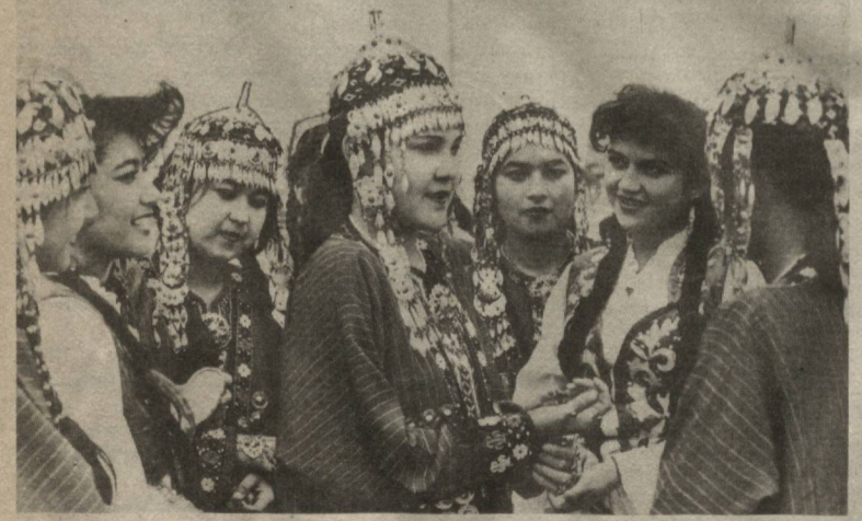
Тили, урф-олати бир-бирига яқин бўлган ўзбек ва туркман халқи азал-азалдан ҳамкору ҳамнафас бўлиб келган. Қашқадарё виллояти ва Туркменистоннинг Лебан виллояти вакиллари баъзида хурсанд-чилик кунларини бирга утказишга одалганини. Тантаналарда яқин халқ вакиллари санъаткорлар, чавадозлар ва бошқа соҳа кишилари фаол иштирок этишдилар.

хаков, Парвоз Содиқовлар хо-зида ҳам зур омилкорлик, та-шаббускорлик курсатилмоқда. Чулнинг оғир шароитида турли миллат ва элат вакилларини ҳам-кору ҳамжihat бўлишга, бори-мининг баҳам қуришга, инсонни қадрлашга урипти. Хурматли Президентимиз Ўз-бекистон мустақилликка эриш-гандан кейинги йилларда қулга киритилган улкан муваффақият-ларнинг бош омиллиги кўп миллат-ли кишилар уртқалиги узаро дўстлик, ҳамжihatлик эканли-