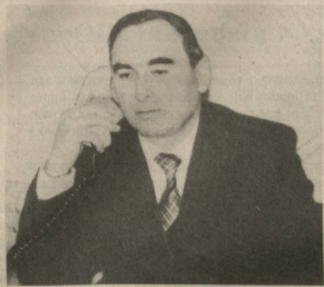
Мехнат сиғайтган табиғат ҳодими, «Хурмат» ордени, «Узбекистонда хизмат кўрсатган соғлиқ сақлаш ходими» фахрий унвони билан таъдирланган. Қўшбоғи у билан бўлиб ўтган сўбат матни келтирилди.