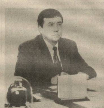
Гулмоқодир ҲАСАНОВ, Сирдарё вилояти ҳоқими, Ўзбекистон Олий Мажлиси депутати

Мустақил Ўзбекистоннинг беш йиллик туйғини нишонлаш арасида турибмиз. Истиқлол сизга нима берди, деган саволга ҳар ким ҳам жуъли жавоб беришни истапти. Биз учун энг муҳими шуки, ота-боболаримиз асрлар буйи орзу қилиб келган озодликка эришдик. Эркинликдан ортиқроқ бахт булиши мумкинми?