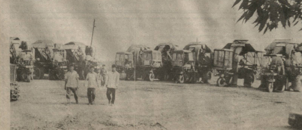
Сифатли таъмирланган зангори кемалар.

Аҳоли саломатлиги ҳам жиддий эътиборда. Керакли анжомлар билан таъминланган қишлоқ шифокорлик амбула-