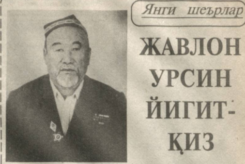
Янги шеърлар ЖАВЛОН УРСИН ЙИГИТ-ҚИЗ

Амир Темуэр 3, 5, 7 йиллик юршилар натижасида жаҳоннинг 27 давлатини ишғол қилган. У «...Қора эгей ва Уртаер денгизларидан то Хиндистоннинг шарқи, Мугулистон ва Хитойгача, Хинд океанидан то Урал тоғлари, Москва остоналари ва Днепр бўйларигача бўлган — дуненинг ярминдан кўпрогини ишғол қилган ҳудудни қўлга киритди. Шундай буюк давлат барпо этган шахсининг қандай одам бўлганини, ҳаммади қизиқтириши табиий. У давлатнинг етук тарихисини, алиби, шоири ва қолаверса, ҳуқуқшунос олим «Зафарнома»нинг муаллифларидан бири Ибн Арабшоҳ «Амир Темуэр амуқ қарори қатъий, қанчалик аҷиб бўлмасин ҳақиқатни хуш қу-