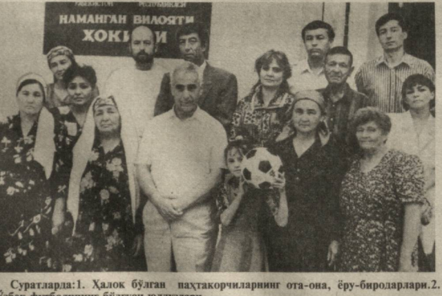
Суратларда: 1. Ҳалок бўлган пахтакорчиларнинг ота-она, ёру-биродарлари. 2. Ўзбек футболининг бўлгуси юлдузлари.

Мехмоннаволикда уйчиликлар ҳам қўстийқлардан қўстийқларини ишбонлашти. Айниқса, 1979 йили авиация ҳалокати туғайди ҳаётдан қў юмган марҳум пахтакорчилар ота-оналари, ақин қариндошлари, радио, телевидение, матбуот вакиллари тушган автобуснинг шаҳарга қираверишида нон-туз билан, уйингуде эса олқишлар билан қутиб олганига, шаҳар стадионидан марҳум пахтакорчиларга атаб махсус хиебон ташқил этилганлиги ва бошқа қўтлаб тадбирлар туманда футболга эътибор, меҳр-муҳаббат қай даражада юқори эканлигинан далолатдир.