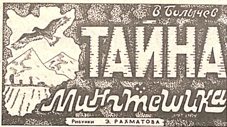
Рисунки Э. РАХМАТОВА