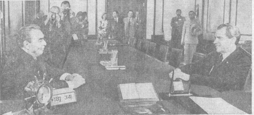
Во время беседы в Кремле.

27 июня в Кремле Генеральный секретарь ЦК КПСС Л. И. Брежнев имел беседу с Президентом США Р. Никсоном по некоторым вопросам советско-американских отношений. Была выражена обоюдная уверенность в том, что предстоящие переговоры в Москве будут способствовать закреплению тех положительных изменений, которые явились результатом советско-американских встреч на высшем уровне в 1972 и 1973 годах, и внесут новый вклад в дальнейшее развитие отношений между Советским Союзом и Соединенными Штатами и тем самым в упрочение всеобщего мира. (ТАСС).