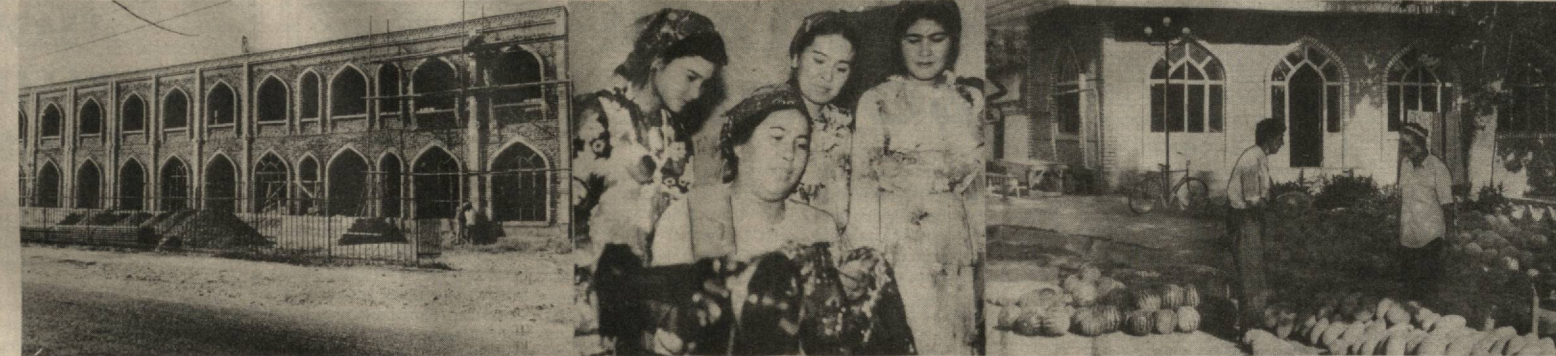
Наманган — гуллар ўлкаси. Уни дилдан севган инсон табиатнинг ҳақиқий шайдосидир. Вилоят нафақат гуллари, балки узининг галлазорларини пахтазорлари, боғу-роғлари билан ҳам овғизга туш- ган. Истиқлол наманганликларга Эркин фаолият юритиш, қадрият- ларни тиклаш, маънавиятни юксалтириш, шаҳару қишлоқларни обод қилиш имкониятини ҳам берди. Сўнгги пайтда вилоятда йирик ҳўжалик корхоналари, йирик бозорлар, савдо марказлари, гузарлар, қишлоқ ва маҳаллаларда маданият марказлари, кичик ва кўнча корхоналар пайдо бўлди. Янги замон Наманган заминига ўзгача чирой ва яққол бахш этди.

Раҳмонали АКБРАЛИЕВ, «Қишлоқ ҳаёти» махсус муҳбири.