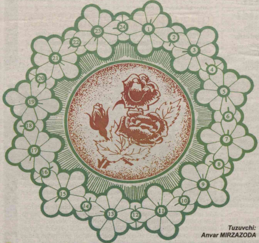
Tuzuvchi: Anvar MIRZAZODA