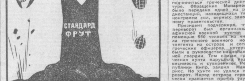
Американские «фрукты». Рис. Н. ЛУЗНИНА.

Американские фруктовые монополии организуют заговоры и ведут подпольную деятельность против правительства Папаяса, Коста-Рики, Гондураса и других республик.