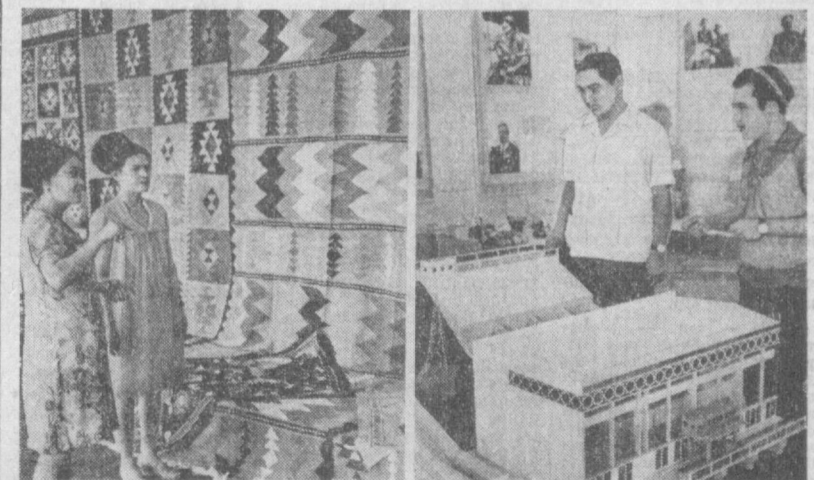
На ВДНХ Узбекской ССР в Ташкенте начались дни показа достижений Кашкадарьинской области. На снимках: слева — образцы изделий предприятий местной промышленности области; справа — макет одной из строящихся на Главном Кашкадарьинском магистральном канале водоснабжающих станций.

ТБИЛИСИ. 24 июля. (ТАСС). Сегодня в Тбилиси на родину отбыла партийно-правительственная делегация Народной Демократической Республики Польша во главе с Генеральным секретарем Центрального Комитета Национального фронта, членом Президиума совета, председателем Постоянного комитета Высшего народного совета ИДРП Абдель Фаттахом Исмаиловым. Она находилась в СССР с официальным визитом по приглашению ЦК КПСС, Президиума Верховного Совета СССР и Советского правительства.