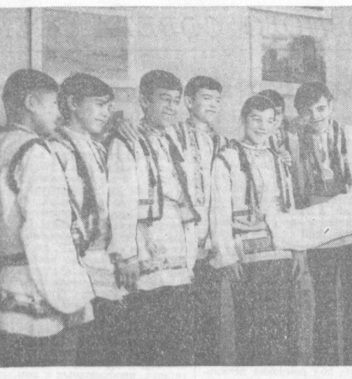
Городской Дом культуры № 1 в Фергане открыт для всех. Его многочисленные кружки и студии посещают более 1.000 человек. Особенно оживленно здесь в дни летних школьных каникул. На снимке: танцоры из ансамбля «Юность» во время репетиции.

Ташкент. 17.30 Программа. 17.35 «Лугуша и вальс». Мультифильм для детей. На узбекском языке. 18.10 «Еш кич». 18.40 «Экран народного контроля». На русском языке. Узбекском языке. 19.10 «Броненосец Потемкин». Художественный фильм. 20.15 «Лугуша». На узбекском языке. 21.05 «Ахборот». 21.05 Концерт для передовиков социалистического соревнования. 21.55 «Программа». 22.00 «Время». Ташкент. 22.30 «50-летию образования Узбекской ССР и Компартии Узбе-