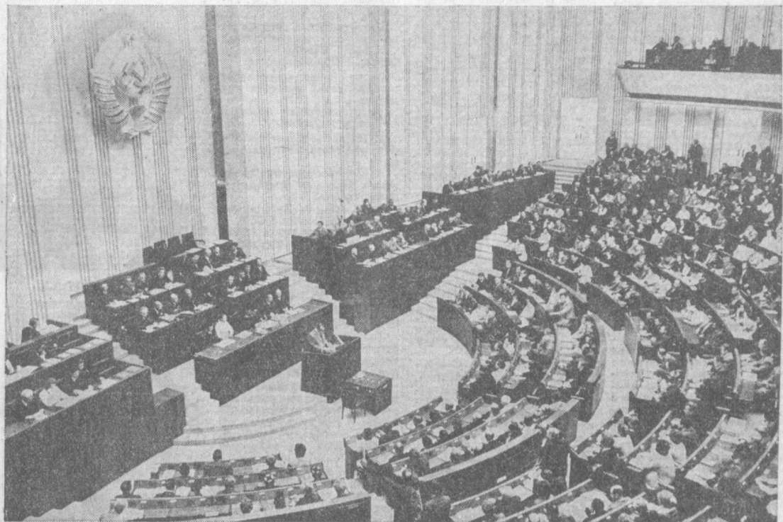
Москва, Кремль, 25 июля 1974 года. Первая сессия Верховного Совета СССР девятого созыва. На снимках: слева — заседание Совета Национальностей, справа — заседание Совета Союза.