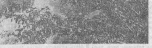
НА ФОТОКОНКУРС «ЗОЛОТОЙ ЮБИЛЕЙ». В горах Узбекистана.

С. АЛТУНЯНЦ. Общ. корр. «Правды Востока», г. Навои.