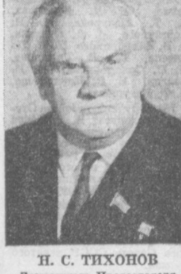
Н. С. ТИХОНОВ, Заместитель Председателя Совета Национальностей