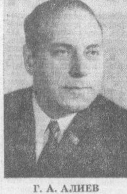
Г. А. АЛИЕВ, Заместитель Председателя Совета Союза