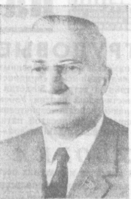
В. П. РУБЕН, Председатель Совета Национальностей

В 15 часов в зале заседаний палат Верховного Совета СССР открылось второе заседание Совета Национальностей. Председательствовал председатель палаты депутат В. П. Рубин. Совет Национальностей заслушал доклад председателя Мандатной комиссии депутата Э. А. Шеварднадзе о результатах проверки полномочий депутатов, избранных в Совет Национальностей Верховного Совета СССР девятого созыва.