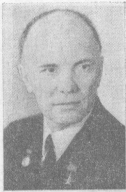
Б. Е. ПАТОН, Заместитель Председателя Совета Союза