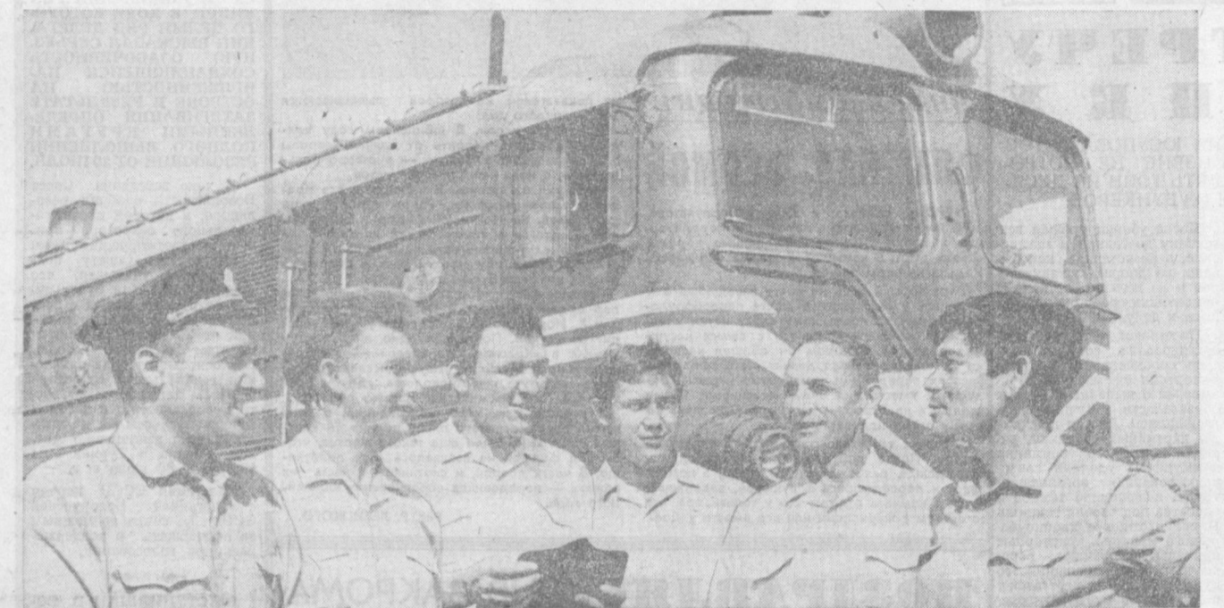
В первом полугодии нынешнего года среди малотоннажных тепловозов Среднеазиатской железной дороги первое место занял коллектив Ташкентского тепловозного депо. Ташкентские железнодорожники — победители социалистической соревнования за безаварийность движения, соблюдение графика, выделение тепловозных поездов, перевыполнение народнохозяйственных грузов и перевыполне-