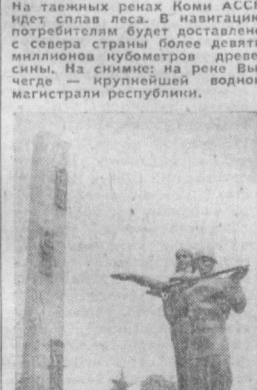
27 июля Львов праздновал 30-летие освобождения от немецко-фашистских захватчиков. На снимке: монумент Славы Советской Армии во Львове.