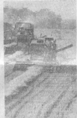
На хлебных нивах юга Молдавии — уборочная страда. На снимке: подбор валков пшеницы в колхозе «40 лет Октября» Чадыр-Лунгского района.