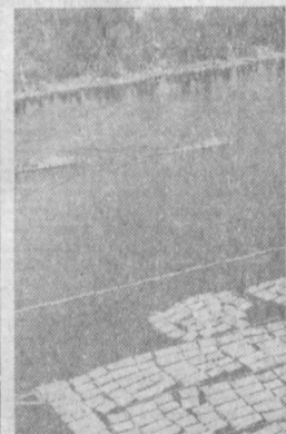
На таежных речах Коми АССР идет сплав леса. В навигацию потребителям будет доставлено с севера страны более девяти миллионов кубометров древесины. На снимке: на реке Вычегде — крупнейшей водной магистрали республики.