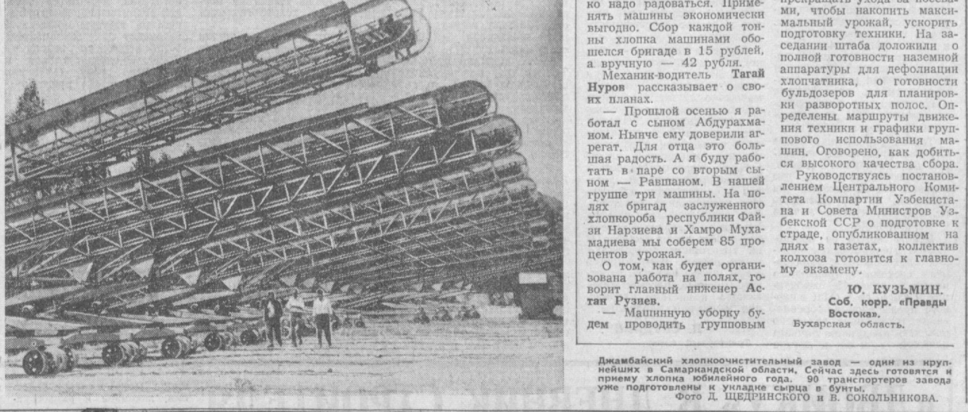
Джизакский хлопкоочистительный завод — один из крупнейших в Самаркандской области. Сейчас здесь готовится прием урожая юбилейного года. 90 тракторов завода уже подготовлены и уложены сырьем в бункеры.

Оперативные данные о заготовке зерна на 19 августа (первая колонка — заготовлено с начала сезона в тоннах, вторая — в процентах к нархозплану) Самаркандская 31.229 71,3 Кашкарская 51.193 69,2 Сурхандарьинская 14.366 69,3 Бухарская 9.297 49,9 Ташкентская 21.002 40,4 Ферганская 8.527 38,7 Андижанская 11.397 36,8 Джизакская 30.802 32,9 Самаркандская 5.555 15,9 Сырдарьинская 2.317 7,1 АССР — — Хорезмская — — По Узбекистану 185.681 39,3