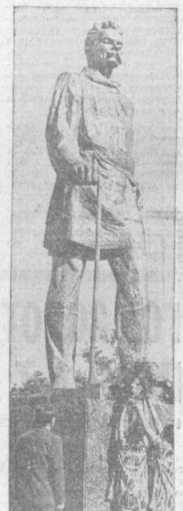
Перед собравшимися предстает шестиметровая фигура Максима Горького. На гранитный пьедестал ложатся цветы.

2 СЕНТЯБРЯ, накануне 40-летия Первого съезда советских писателей, избравшего своим председателем А. М. Горького, на одной из новых площадей столицы Узбекистана открыт памятник великому пролетарскому писателю. Изваянный из бронзы, Максим Горький словно идет по площади. За ним высятся дома, поднявшиеся на проспекте, носимом его имя. Светлые, многоэтажные, оживленные зелеными молодыми деревьями и красными сентябрьских роз, эти жилые кварталы — одно из ярких воплощений горьковских слов о человеке, о красоте труда его, о доброте сердца. Митинг, посвященный открытию памятника, открыл первый секретарь Ташкентского горкома партии А. А. Ходжаев. Мы, советские писатели, подчеркнул на митинге секретарь правления Союза писателей Узбекистана А. А. Удалов, счастливы, что у нас есть Горький, объединивший все наши национальные советские литературы в единую семью. И не найти ни одного советского писателя, который не считал бы Горького своим учителем.