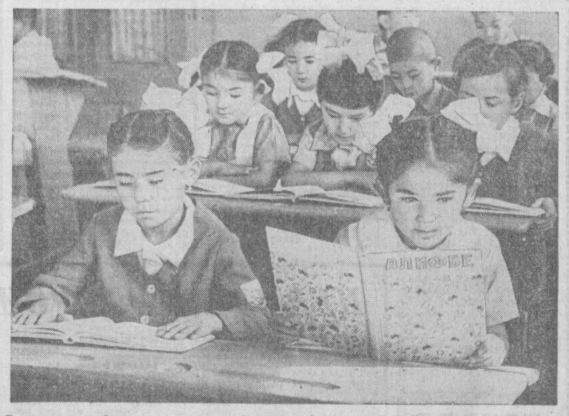
Прозвенел первый звонок нового учебного года. Для первокурсников это был первый звонок в жизни. С него начался удивительный путь в мир знаний. С волнением переступали юные школьники пороги школы, расставившись за парты, знакомились со своими новыми друзьями-одноклассниками, первой учительницей. Началась для первокурсников новая жизнь, подчиненная строгому графику школьного расписания уроков. Впервые сели за парты и эти дети — ученики первого «В» класса школы № 144 Фрунзенского района Ташкента.

франко-советском боевом братстве, скрепленном в совместной борьбе за свободу и независимость наших двух стран. Я убежден так же, как и вы, подчеркивается в телеграмме, что отношения сотрудничества и дружбы, существующие между нашими государствами, будут дальше развиваться во имя их общего благополучия и в интересах мира. (ТАСС).