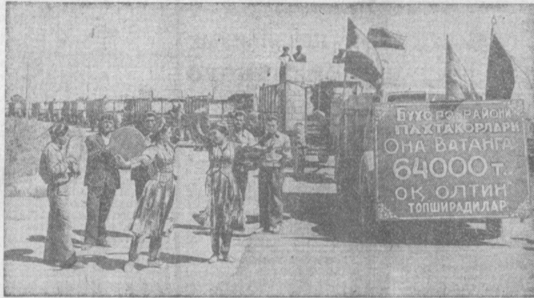
64 тысячи тонн «белого золота» обмолотили в юбилейном году. На заготовительный пункт бухарского хлопковода уже отправлено более двухсот тонн сырца. На снимке: красный колос хлопчатника бухарского района направляется на завод.

В уборку включаются все новые и новые районы ДАДИМ РОДИНЕ 5.000.000 ТОНН ДОБРОТНОГО СЫРЦА!