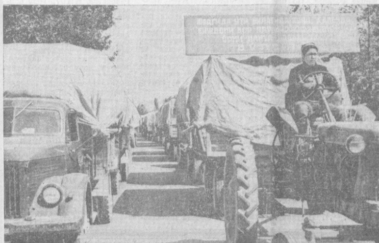
В Андиканской области начался сбор урожая. Красный обнос хлопком нового урожая, собранного на полях хозяйства Кургантепского района, направляется на заготовительный пункт.