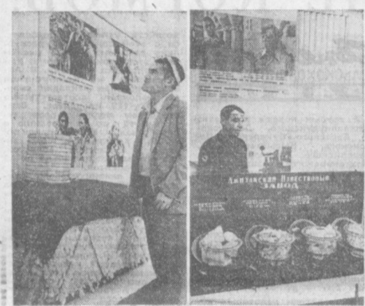
Стенды, установленные на ВДН Узбекистана ССР, на которых демонстрируются достижения трудящихся Джизакской области.

В. УСМАНОВ. Министр хлопководческой промышленности Узбекской ССР.